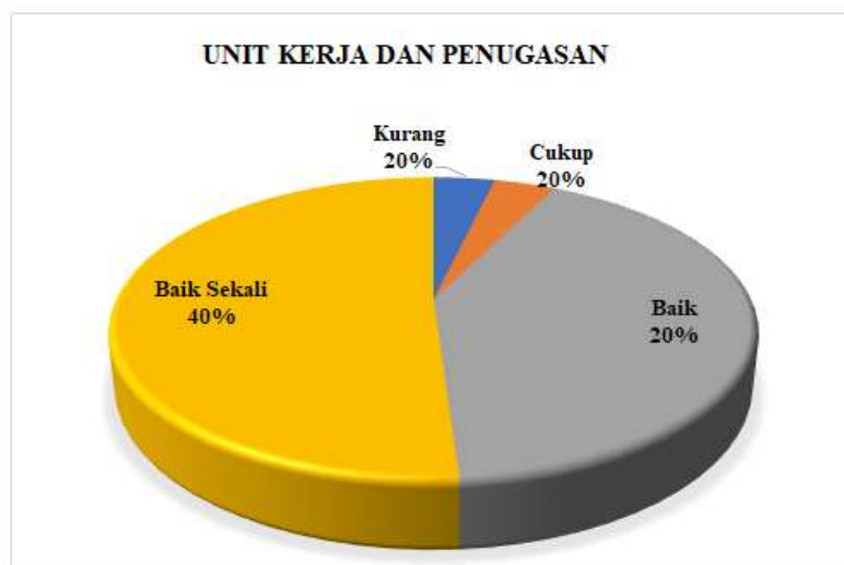
Diagram 3.1 Presentase Hasil Survei Kepuasan Tenaga Kependidikan terhadap Layanan Manajemen Prodi Akuntansi pada Aspek Unit Kerja dan Penugasan