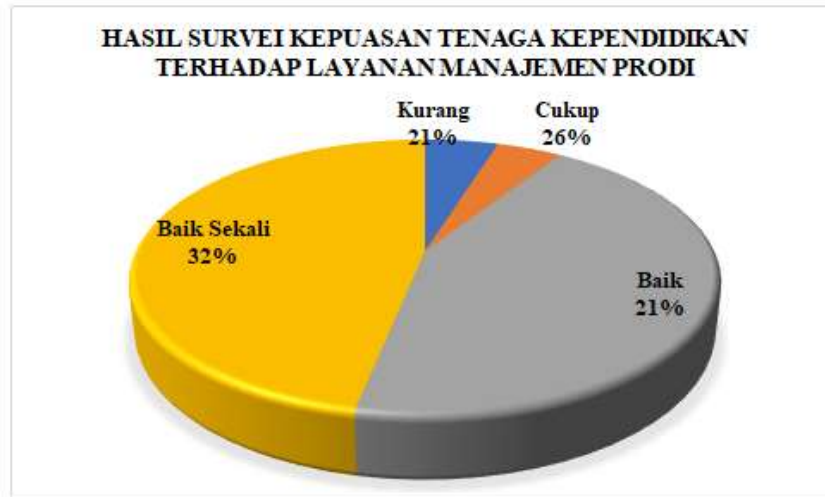
Diagram 4.1 Persentase Hasil Survei Kepuasan Tenaga Kependidikan terhadap Layanan Manajemen Prodi Akuntansi

Berdasarkan hasil survei dapat dilihat pada Diagram 4.1 yang menggambarkan bahwa secara keseluruhan Tenaga Kependidikan program studi Manajemen memberikan nilai Baik Sekali sejumlah 32%, nilai Baik sejumlah 21%, nilai Cukup sejumlah 26%, nilai kurang 21%. Jika merujuk pada Tabel 2.3 nilai persentase tersebut berada pada rentang 0-40%, sehingga dapat disimpulkan bahwa kepuasan Tenaga Kependidikan terhadap Layanan Manajemen Prodi di program studi Akuntansi masuk pada kategori KURANG .