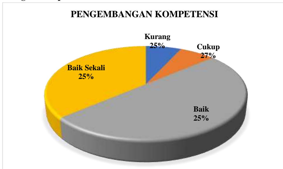
Diagram 3.2 Persentase Hasil Survei Kepuasan Tenaga Kependidikan terhadap Layanan Manajemen Prodi Akuntansi pada Aspek Pengembangan Kompetensi

Berdasarkan Diagram 3.2 di atas dapat dilihat bahwa Tenaga Kependidikan memberikan nilai Baik Sekali sejumlah 25% dan Baik sejumlah 25% pada aspek Pengembangan Kompetensi. Nilai terbanyak terdapat pada poin 2.4 : Pengembangan diri untuk mengikuti kursus /pelatihan ataupun sertifikasi kompetensi. Sedangkan Tenaga Kependidikan yang memberikan nilai cukup sejumlah 27% dan memberikan nilai kurang sebesar 25% pada aspek ini. Sehingga pada aspek Pengembangan Kompetensi berada pada kategori Baik .